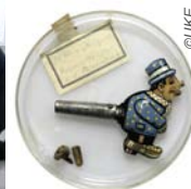
Exponat aus der Sonderschau „verschluckt und ausgestellt“ im UKE-Museum