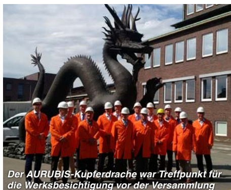
Der AURUBIS-Kupferdrache war Treffpunkt für die Werksbesichtigung vor der Versammlung