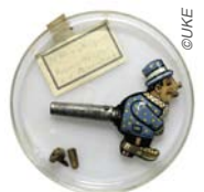
Exponat aus der Sonderschau „verschluckt und ausgestellt“ im UKE-Museum