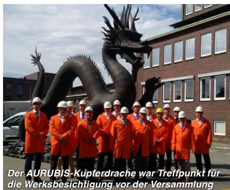
Der AURUBIS-Kupferdrache war Treffpunkt für die Werksbesichtigung vor der Versammlung